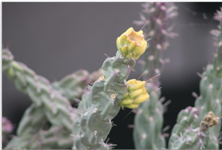
Fig. 2. Jardín Etnobiológico en Viesca