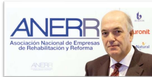
Figura 1. Foto del presidente de ANERR.

confort, el ahorro energético y la salud, donde el usuario es el centro de las acciones y es importante tomar en cuenta sus necesidades.