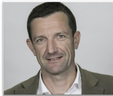
Figura 2. Foto del director general de GBce.