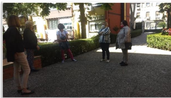
Foto 2. Segunda reunión en edificios catalogados como patrimonio, mayo 2021

Yo no creo que sea posible rehabilitar las viviendas, ya que al ser catalogadas como patrimonio limita las modificaciones que se puedan hacer con el objetivo de mejora en la calidad de vida, foto 2.