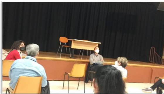
Foto 1. Reunión de la comunidad de vecinos comentando sobre el tema, mayo 2021

He visto de primera mano las bondades que se logran mediante la rehabilitación, ya que tengo conocidos que viven en las viviendas ya rehabilitadas y su calidad de vida ha mejorado, así mismo, el pago de las facturas se redujo en una cantidad considerable, por lo tanto, estoy a favor de hacerlo, foto 1.